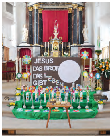
Im Leben möchten wir wachsen und blühen.