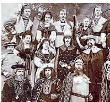
Theatergruppe Buochs (Ausschnitt), um 1901.

Die Betroffenenorganisation IG Miku unterstützt Betroffene auch bei spirituellem Missbrauch: missbrauch-kirche.ch