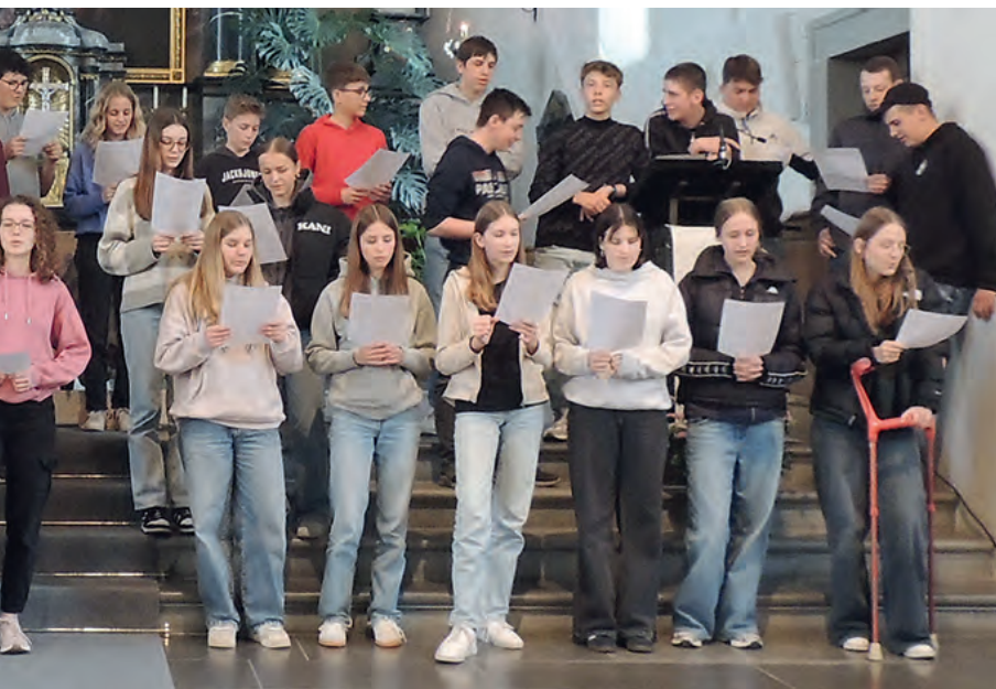
Singprobe am Vorbereitungstag