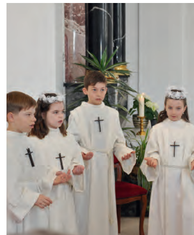
Wir singen, loben, staunen.