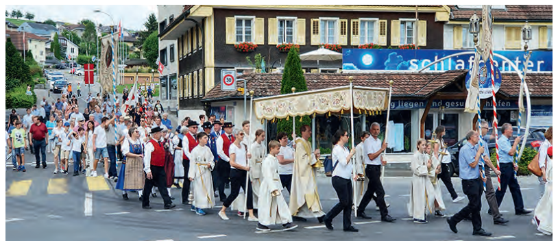
Fronleichnamprozession Neuenkirch 2020 (Foto links von 2017)