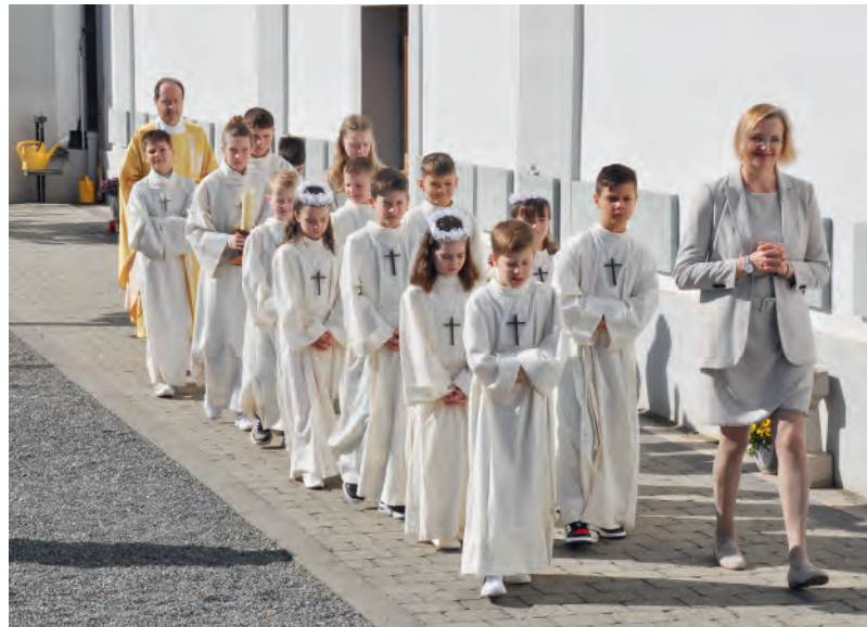
Auf dem Weg zum Festgottesdienst