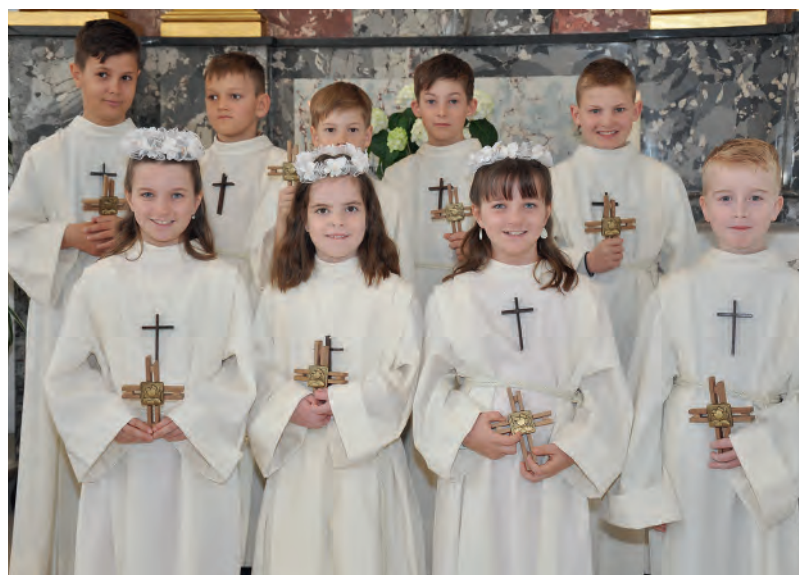
Die Gruppe der Erstkommunikanten mit ihrem Andenken «Jesus bliib du emmer bi mer...».